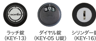
ラッチ錠 (KEY-13) ダイヤル錠 (KEY-05 U錠) シリンダー錠 (KEY-16)