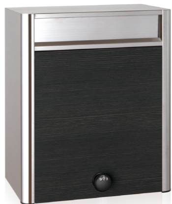
PF704ES バイン ダイヤル錠 (ダイノック™ FW-641)