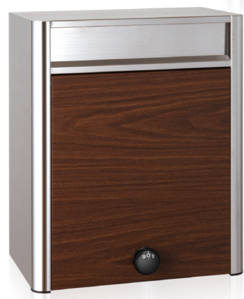
PF704ES ウォールナット ダイヤル錠 (ダイノック™ FW-332)