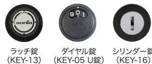
ラッチ錠 (KEY-13) ダイヤル錠 (KEY-05 U錠) シリンダー錠 (KEY-16)