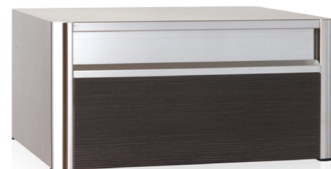
P701ES パイン 投入口 (ダイノック™ FW-641)