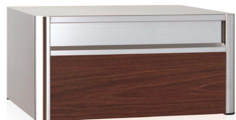
P701ES ウォールナット 投入口 (ダイノック™ FW-332)