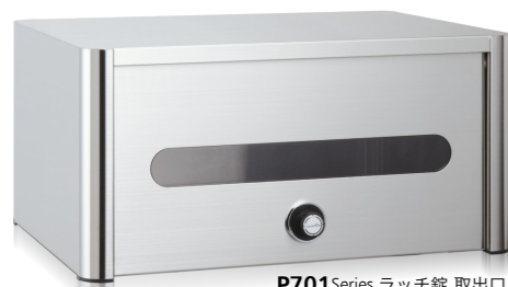
P701Series ラッチ錠 取出口